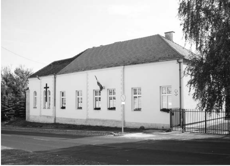
4. fénykép: A sopronkőhidai iskola

A Sopront és környékét ért amerikai és orosz bombatámadások elkerülték Sopronkőhidát. A Számonkérő Különítmény hadbírószága szinte folyamatos ítélezett, a légiriadók és bombázások zavart okoztak ugyan, de nem akadályozták hadbírószág munkáját. [111] Nem így az 1945. február 16-án, kiütéstífusz miatt a fegyházban elrendelt vesztegzár: megszűntek a kihallgatások és a tárgyalások. [112] Így a 3–6 hét hosszúra becsült egészségügyi zárlat többek életét megmenthette volna. Nem így történt azonban, mivel a zárlatot alig egy héttel később, február 22-én feloldották. [113] A hadbírószág ezután újult erővel folytatta a kihallgatásokat és tárgyalásokat. A sopronkőhidai halálos ítéletek kiszabása és a kivégzések tovább folytatódtak. A rögtönítélő bíróság ítélete ellen fellebbezésnek nem volt helye. A halálos ítéleteket a kihirdetést követő két órán belül, vagy másnap reggel hajtották végre a fegyház udvarában. [114] A siralomház a fegyház III. emeletén volt. [115] A kivégzettek földi maradványait a rabtemetőben temették el. [116]