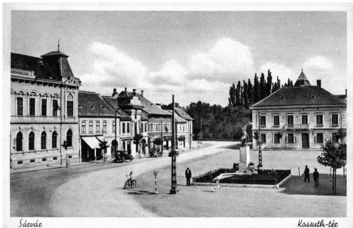
5. fénykép: A kivégzés helyszíne Sárváron (képeslap az 1940-es évekből)