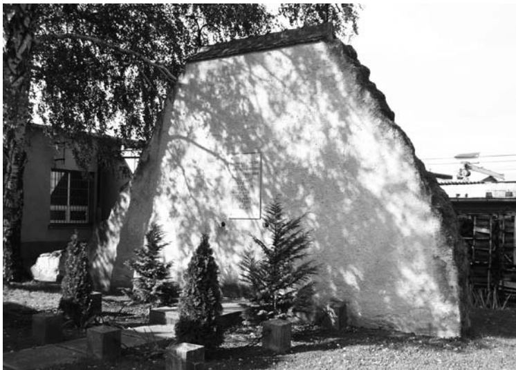
3. fénykép: Kivégzőfal a sopronkőhidai fegyházban. [75]