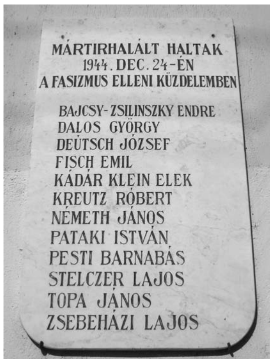
9. fénykép: A kivégzett mártírok emléktáblája a sopronkőhidai fegyház falán