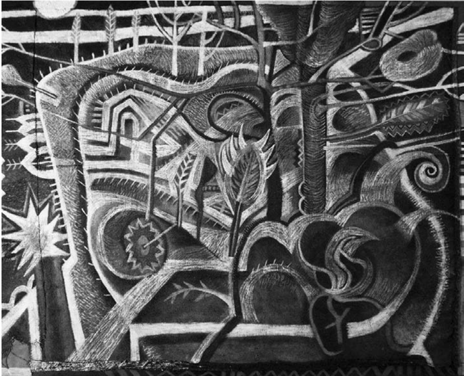
• Vándor a rengetegben